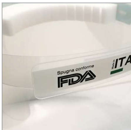
Chiusura con Velcro